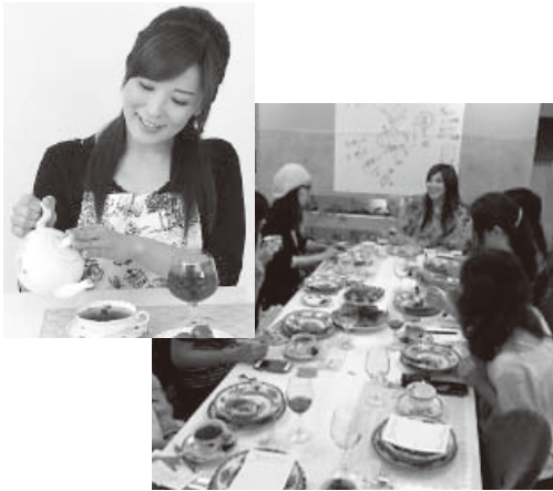
URL / http://ameblo.jp/harukaarisawa/

・体調に合わせた紅茶レシピの紹介も しています。「あなたの価値観で、あ なたの居場所をもっと素敵にしてほ しい」というコンセプトの通販サイ トMonoria (モノリア) 内で、オーガ ニックオーガニックハーブティー を購入された方に、その方にあった おすすめ紅茶を使った体調改善 レシピをプレゼントで添えさせてい だいています (レシピ例・トマト