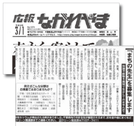
「広報ながれやま」に掲載された先生募集の告知記事

これらは、インターネットで各地のボランティア人材バンクで調べられますが、各地域の広報紙でも告知していますので、知ることができます。