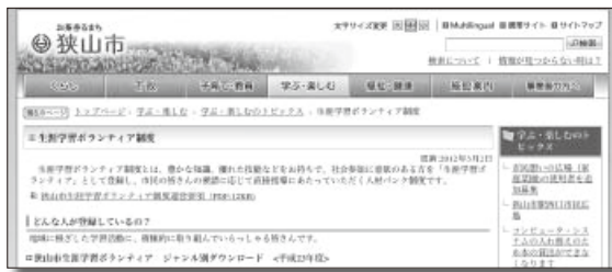
狭山市ホームページの「生涯学習ボランティア制度」のページ