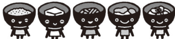
岩手県イメージキャラクター「わんこきょうだい」

昨年は高知市で開催し、多くの学習指導員の方々の活発な交流が行われました。詳しくは後日ご案内申し上げます。