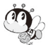
生涯学習マスコット「マナビ」