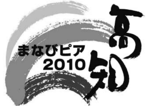
「まなびピア高知2010」のロゴ

会です。文部科学省、高知県教育委員会、生涯学習の研究者の先生方にもご挨拶を頂戴し、学習指導員活動の体験を発表していただくものです。昨年はさいたま市で開催され、多くの学習指導員の方にご参加いただき、有意義なお時間を過ごしていただきました。詳しくは後日ご案内を申し上げます。